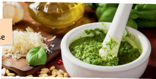
La ricetta del pesto genovese