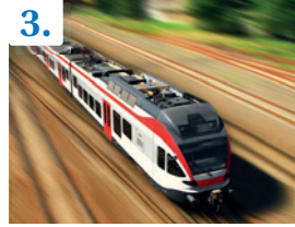
Tren de alta velocidad