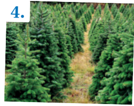
Árbol de navidad natural