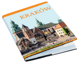
album o Krakowie