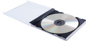
płyta kompaktowa / kompakt