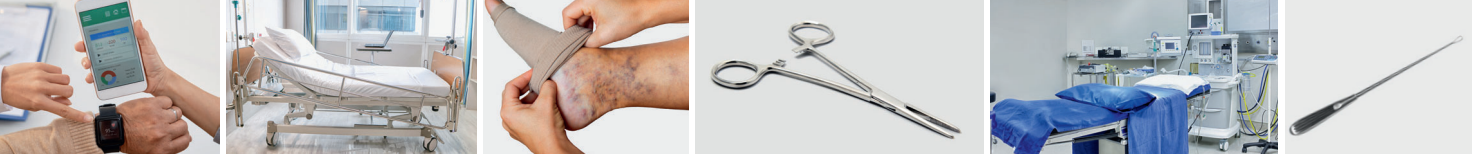
● Medical App