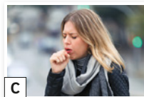
C eine _____ ● Frau