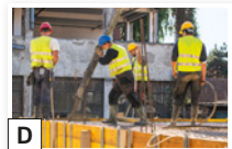
D _____ ● Männer