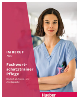
Im Beruf NEU, Fachwortschatztrainer Pflege ISBN 978-3-19-321190-3