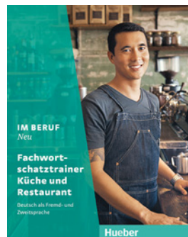
Im Beruf NEU, Fachwortschatztrainer Küche und Restaurant ISBN 978-3-19-351190-4