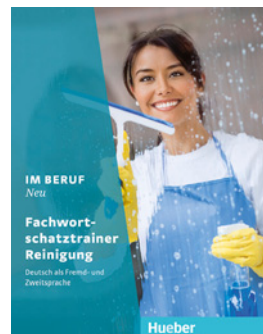
Im Beruf NEU, Fachwortschatztrainer Reinigung ISBN 978-3-19-371190-8