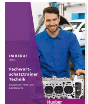
Im Beruf NEU, Fachwortschatztrainer Technik ISBN 978-3-19-311190-6