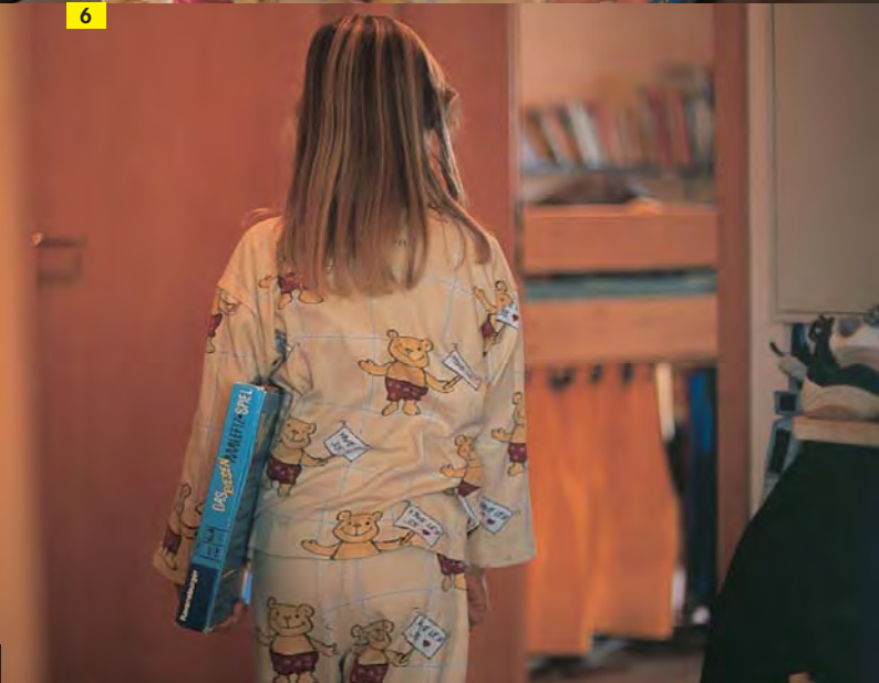
FOLGE 5: NUR EIN SPIEL!