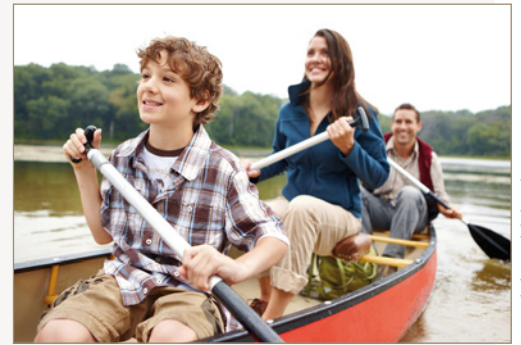
Paddeln im Spreewald

Allein, mit Freunden oder mit der Familie, für mehrere Tage, als Tagesausflug oder als regelmäßiges Training im Alltag: Paddeln bietet viele Möglichkeiten und ist auch bei Nicht-Profis ein beliebter Freizeitsport.