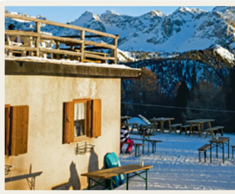
ein Bergrestaurant in den Schweizer Alpen