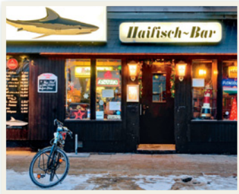
eine Kneipe am Hamburger Hafen