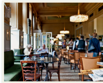
ein Kaffeehaus in Wien

► 1148 b Lesen Sie und hören Sie. Vergleichen Sie dann Ihre Antworten in a mit dem Text.