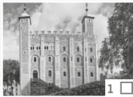
Tower of London

3 Listen again and tick the things they saw in London. Hören Sie noch einmal und kreuzen Sie die Dinge an, die die Frau mit ihrem Freund in London gesehen hat.