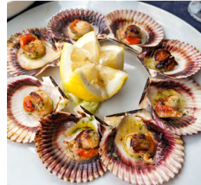
les coquilles Saint-Jacques

Je suis un poulet rôti tendre et délicieux. Je suis un plat principal du repas de Noël. On me sert en général avec des marrons et des champignons.