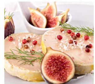
le foie gras

Je pétille et je suis emblématique de tous les bons repas français. J'accompagne les mets raffinés pour rendre les repas encore plus festifs.