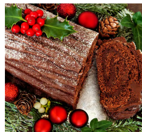
la buche de Noël

J'arrive quand on a trop mangé pendant les repas copieux de Noël. Je rappelle qu'il faut manger avec modération, même à Noël !