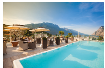
hotel 4 stelle