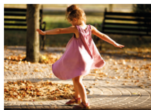
6 luftige Kleidung tragen