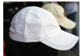
4 Kopfbedeckung tragen