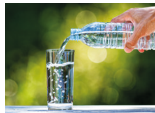
3 viel Flüssigkeit trinken