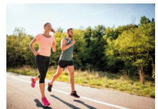
8 viel Sport