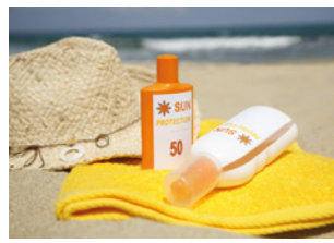
2 Sonnencreme mit hohem Lichtschutzfaktor