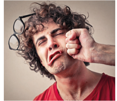
3 Hitzeschlag ☺