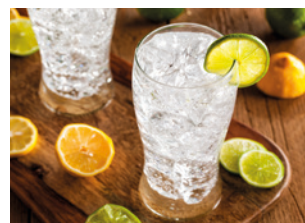
7 kalte Getränke