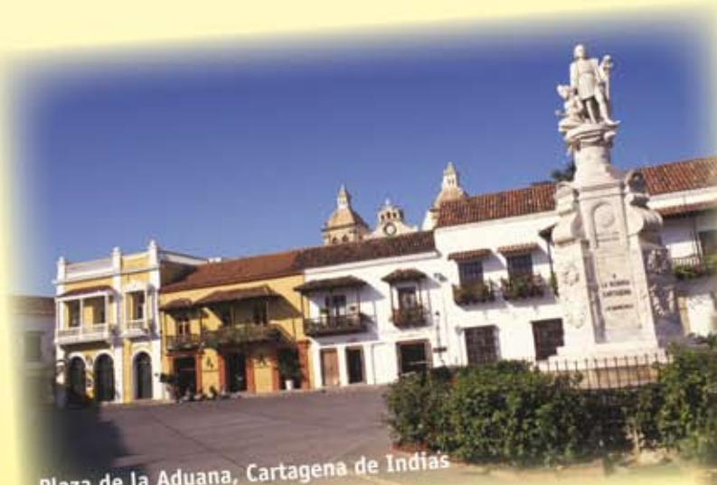
Plaza de la Aduana, Cartagena de Indias