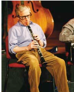
Woody Allen tocando clarinete

Diálogo de abajo, donde deciden ir a tomar pinchos al casco viejo.