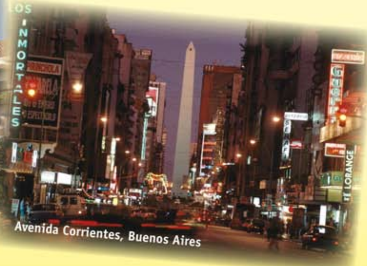
Avenida Corrientes, Buenos Aires