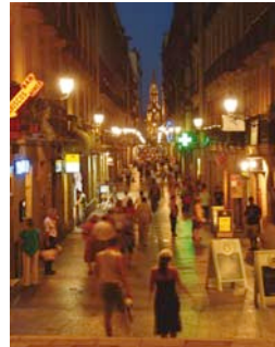
Casco viejo de San Sebastián