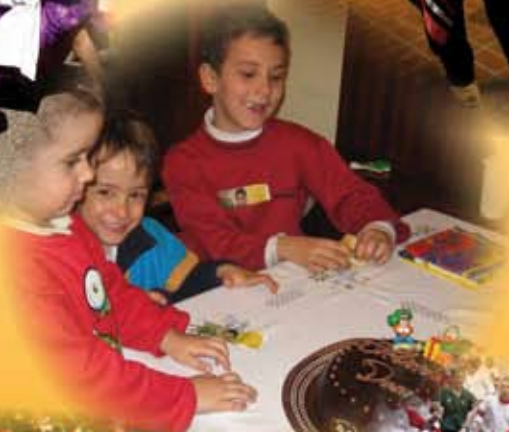
Fiesta de cumpleaños