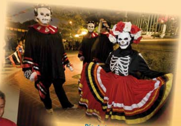
Día de los Muertos (México)