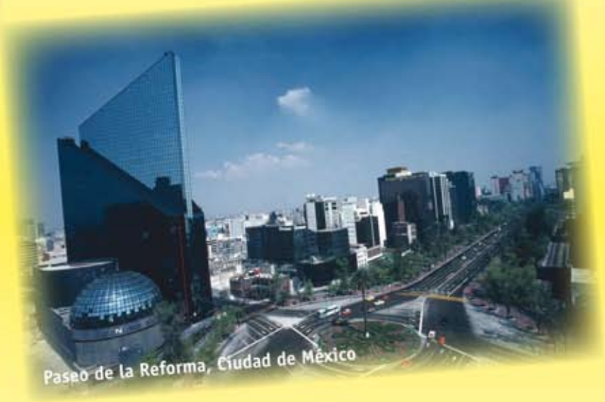
Paseo de la Reforma, Ciudad de México