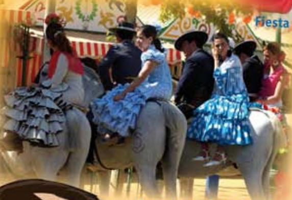
Feria de Abril de Sevilla (España)