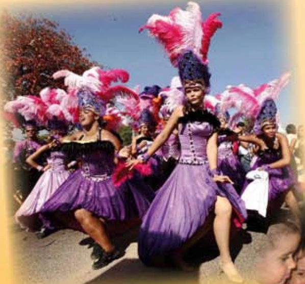
Carnaval de Santo Domingo (República Dominicana)