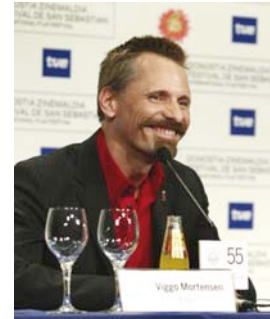
Rueda de prensa

Diálogo de abajo, donde deciden ir a tomar pinchos al casco viejo.