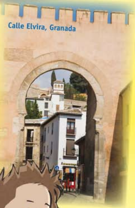
Calle Elvira, Granada