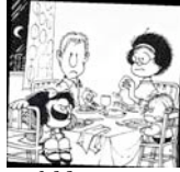
Mafalda, sus ..... y su ..... relaciona