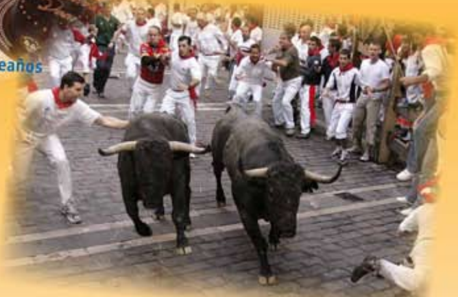
San Fermín (Pamplona, España)