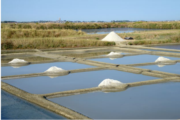
Les salines de Guérande