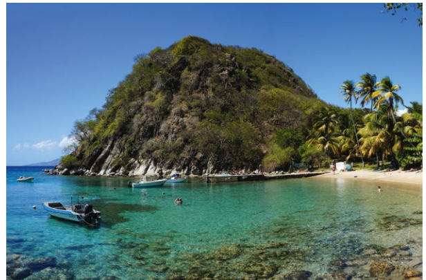
Iles des Saintes