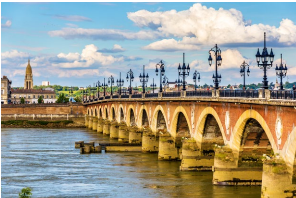
Bordeaux, le pont de Pierre