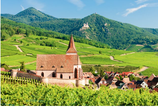
L'Alsace, le village d'Hunawihr