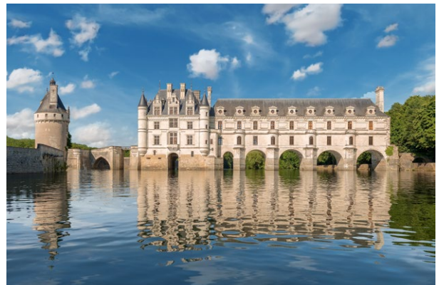
Le château de Chenonceau

Le massif du Mont-Blanc © iStock/Lucyna Koch; L'abbaye de Fontenay © iStock/lenazap; La Côte de Granit rose © Thinkstock/iStock/j-wildman; Le château de Chenonceau © fotolia/thomaslenne