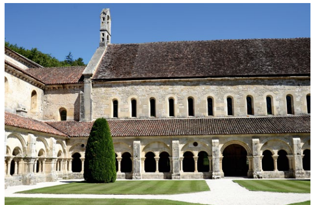
L'abbaye de Fontenay