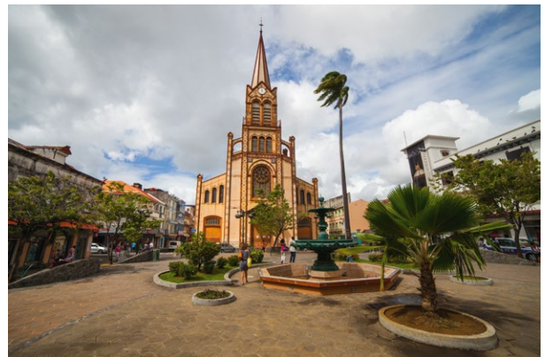
Fort-de-France, la cathédrale Saint-Louis

Les salines de Guérande; Menton; Bonifacio; Iles des Saintes; Singe écureuil; Fort-de-France, la cathédrale Saint-Louis