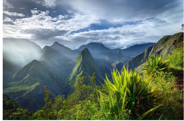
Le cirque de Mafate

Mayotte; Le cirque de Mafate