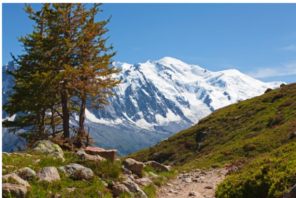
Le massif du Mont-Blanc