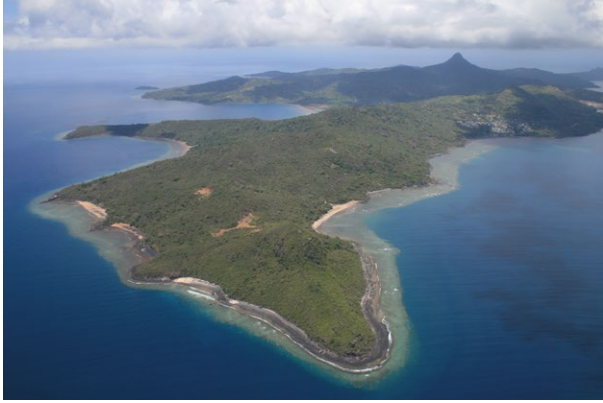
Vue du ciel