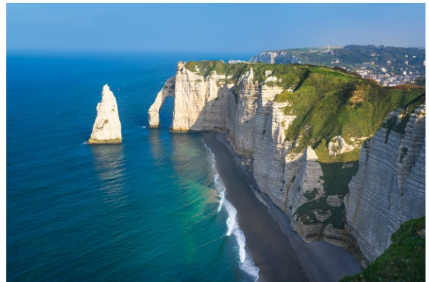
Les falaises d'Étretat