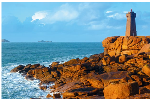
La Côte de Granit rose