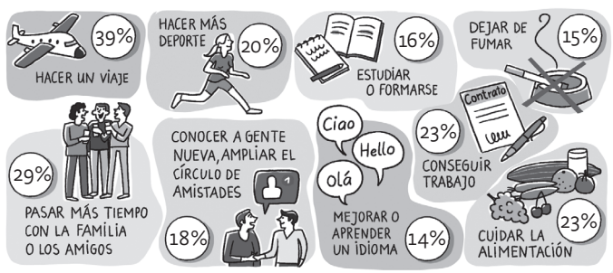
Illustration: Mascha Greune